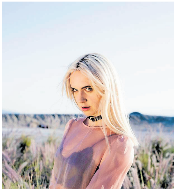
■ MØ är ett riktigt muminfan som nu är aktuell med ledmotivet till den nya muminserien.