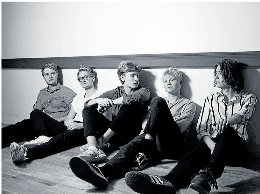
■ Gruppen Mares är aktuell med en vemodig låt med ett hoppfullt budskap.